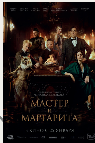
Мастер и Маргарита (2023)